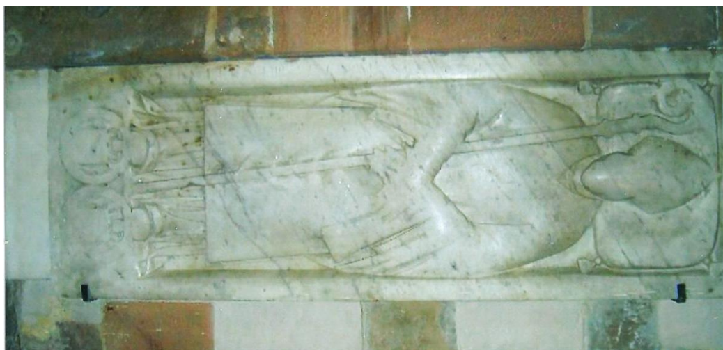
Gisant de G. de Ruffec. Cathédrale de Fréjus