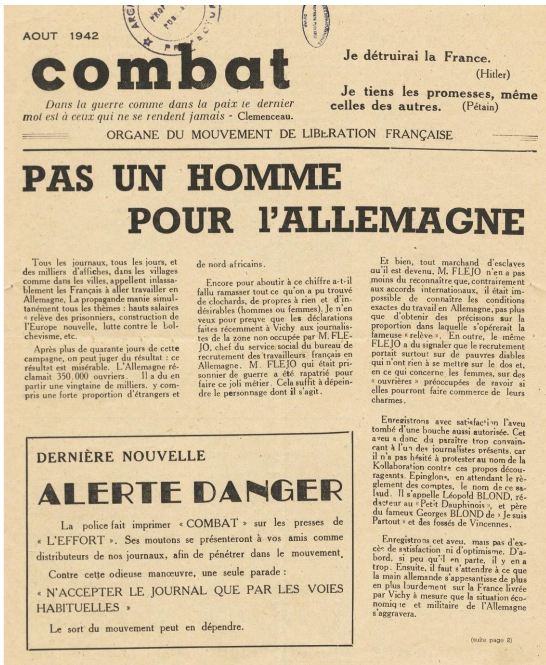
Journal Combat , août 1942 7

Le premier noyau de résistance apparaît à l'initiative de quelques officiers qui refusent la défaite et que le capitaine Henri Frenay a convaincu de participer au mouvement dont il a jeté les bases chez sa mère, à Sainte-Maxime : le Mouvement de libération nationale (MLN). Les camps de Fréjus sont avec les casernes de Marseille – où il est affecté – ses premiers lieux de recrutement et le « manifeste » qu'il a commencé à rédiger à Sainte-Maxime circule dans la région jusqu'au printemps 1941, texte fondamental qui expose la ligne qu'il entend suivre et jette les bases de son organisation 6 .