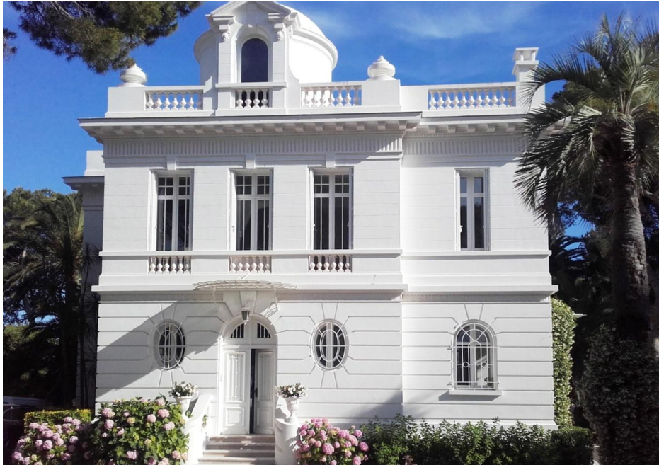
La Villa May

précise « des suites de maladie contractée au front 14 ». Le 13 juillet, le maire Henri-Georges Berger prononce son éloge funèbre devant le conseil municipal 15 .