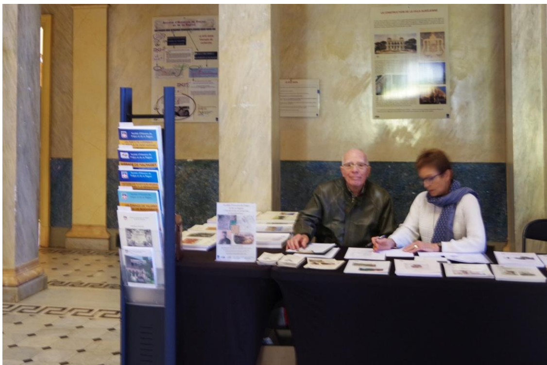
Le stand SHFR