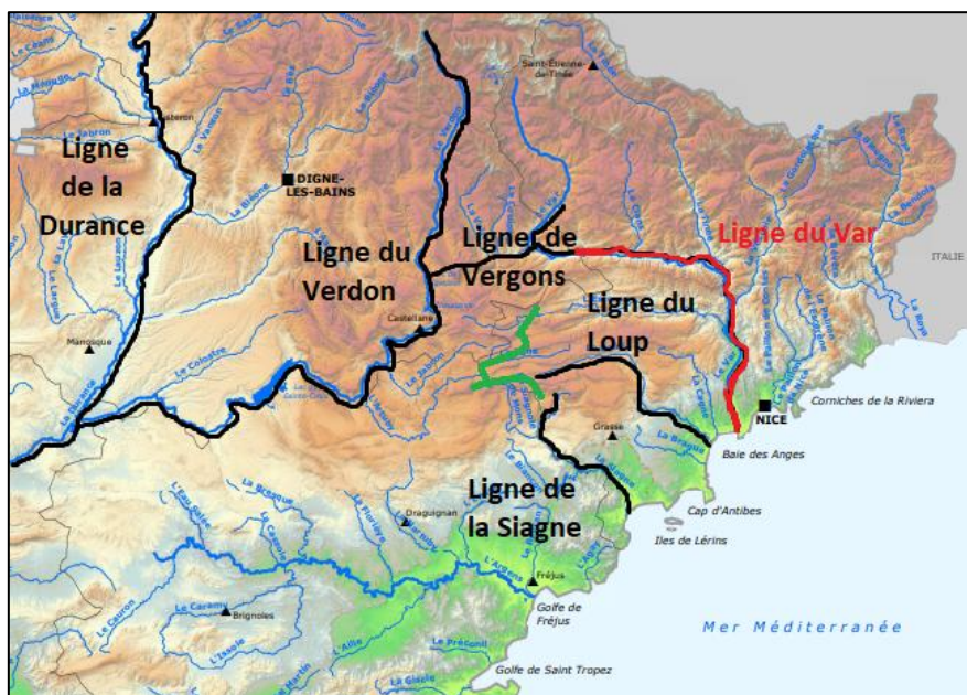
Les lignes de la Provence orientale (en noir tenues par les Français, en rouge par Les Italiens et en vert la barrière militaire) (Carte Google complétée par l'auteur)

Le 18 octobre 1720, sous les ordres du baron de Mouans, une garde de la rivière du Loup est opérationnelle jusqu'au 31 décembre 1721. Les communautés avoisinantes participent à la