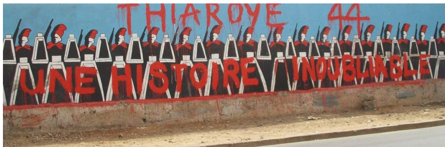
Thiaroye. Fresque murale à Dakar

Étudiant l'histoire des tirailleurs sénégalais à la fin de la Seconde Guerre mondiale, j'avais eu connaissance de plusieurs "incidents" dans lesquels ces soldats, soldats coloniaux de l'armée française, furent impliqués entre le mois d'octobre 1944 et la fin de l'année 1945 ; les principaux eurent lieu à Hyères, Morlaix, Cherbourg, Liverpool, Versailles, Thiaroye et Saint-Raphaël/Fréjus.