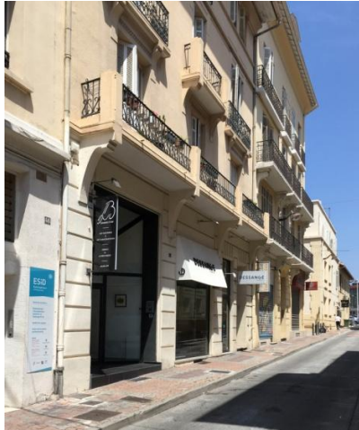
La rue J. Barbier, aujourd'hui

étant donné la distance, je ne pus le suivre exactement et un coup de feu fut tiré. Le Sénégalais fit quelques pas et s'abattit sur le sol. » Le lieutenant Roquebert est alors en civil et ne peut intervenir. Il se rend au bureau de garnison. (...) « Le corps fut amené au bureau de garnison et là, j'appris son identité : Kona Kong [document mal lisible], du 3 e îlot. La patrouille conduisait en même temps les deux tirailleurs camarades du blessé. » Le lieutenant Roquebert a ensuite prévenu le commandant Roux, qui était officier de garnison à Saint-Raphaël.