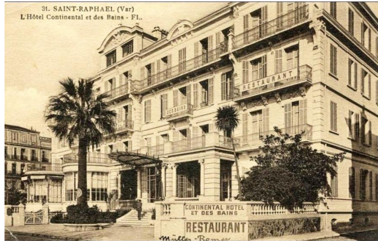
L'ancien hôtel Continental

Le 21 août 1945, l'adjudant-chef de gendarmerie Murati, commandant provisoirement la section de Fréjus, écrit un rapport sur l'affaire. 7 « Le 19 août 1945 vers 20 heures, à Saint-Raphaël (Var), une patrouille commandée par un sous-lieutenant, s'est heurtée à trois tirailleurs sénégalais causant un scandale sur la voie publique et insultant un chef d'escadron et un capitaine de l'Etat-Major de la 1 ère D.C.E.O. Armés de matraques, les tirailleurs ont refusé d'obtempérer aux ordres du Chef de patrouille. Poursuivi par l'officier qui, menacé d'être frappé à son tour, celui-ci a sorti son arme pour intimider le tirailleur lequel voulant désarmer l'officier a été tué d'une balle au poumon gauche. »