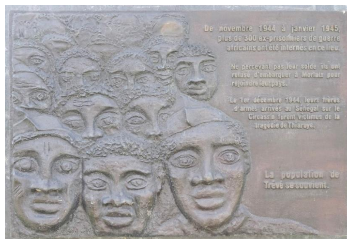
Stèle à Trévé (Côtes-d'Armor) en hommage aux tirailleurs sénégalais et en mémoire du massacre de Thiaroye

Dans le camp de Thiaroye, à l'aube du 1 er décembre 1944, les officiers supérieurs de l'AOF, avec l'accord du gouverneur général, ont fait tirer sur des tirailleurs ex-prisonniers de guerre qui réclamaient leurs rappels de solde. Le bilan fut bien plus lourd que les 35 morts reconnus à l'époque par l'armée; le nombre exact de victimes est encore aujourd'hui inconnu. Les travaux récents d'historiens ont établi qu'il ne s'agissait pas d'une « mutinerie lourdement réprimée », mais d'un massacre sur des hommes désarmés. 57 Perpétrés le 1 er décembre dans la banlieue de Dakar, au Sénégal (territoire de l'AOF à l'époque), ces faits sont, en 1945, ignorés en France de presque tout le monde, du fait de la censure militaire et de la volonté des autorités françaises.